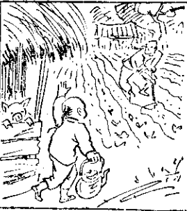
(一) 國父的父親成達，種田牧豬，他苦窮。