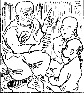
(三) 十歲時大有天平，國事故，深慕洪深，父深慕洪深，而先生復漢族之志。