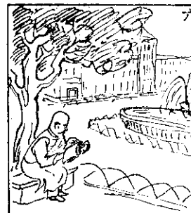
(六) 國父為中國立國所，大農係開發展業與撰常，籍書業農讀好也以文論業農寫。