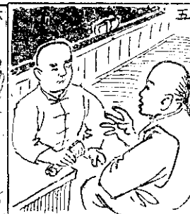
(五) 國父二十歲時到香港，醫學在既。遊交廣可又，世濟可。事大家國談常候時餘課。

嬰兒身體，然後一手托頭及肩部，另一手支撐嬰兒腿彎處，輕輕的將嬰兒放入水中，用小毛巾將肥皂沫洗去。 將嬰兒提出水後，使他躺在大毛巾上或用大毛巾包好，放在桌上，用另一小毛巾輕輕拍嬰兒身體，以便吸乾水份，最後用棉花蘸爽身粉撒遍，特別注意嬰兒腋窩、腿彎、頸下以及皺摺間，要沒有水份而撒有爽身粉，以免發炎。 注意： 替孩子洗澡前應將手洗乾淨。 嬰兒每天至少洗澡一次。洗澡時要在沒有風的地方，如天氣太冷，可先洗頭髮，然後再脫去衣服洗身體。