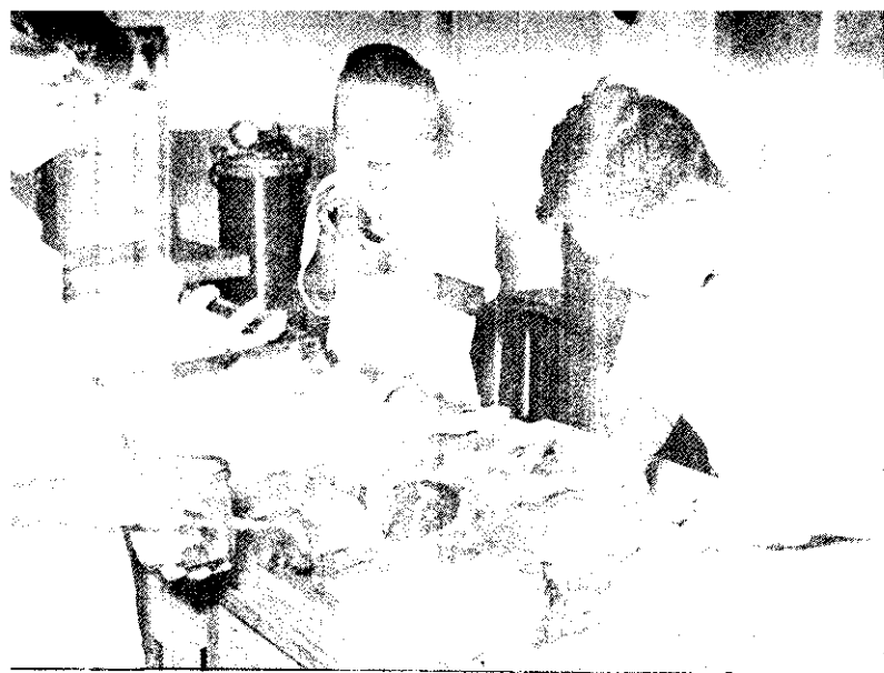
的造製臨前射注在是都，苗按瘟豬化免

光復以來，臺灣的畜牧事業進步極快，尤其是豬的頭數，現在已多到每三個人平均分得一頭的地步。豬的年年增加，足以說明政府的防治豬瘟工作得到了完全的成功，養豬人獲得了安全的保障。 豬瘟和豬丹毒是本省豬的主要傳染病，政府在農復會補助下，使用效力宏大的免化豬瘟疫苗，實施普遍預防注射，和嚴密的檢疫制度以來，已很少發生。這種嚴密的防疫制度，最初是在屏東縣實施的，因為得到農友們的合作，已經收到顯著的效果，現在已擴展到濁水溪以南各縣了。