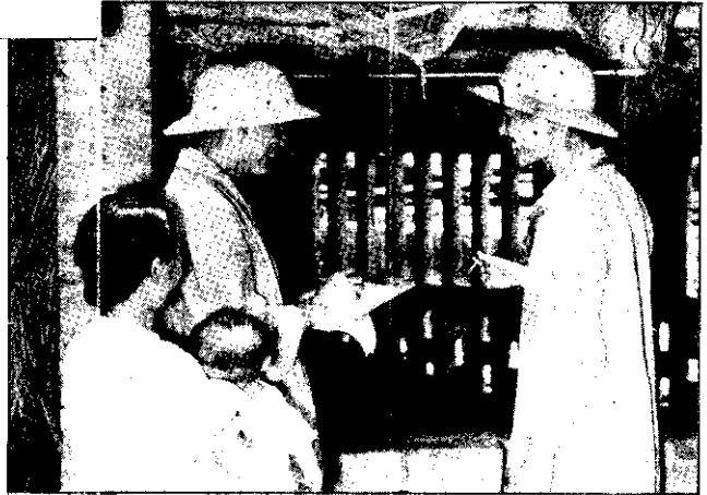
查調康健做要，猪的前射注防預