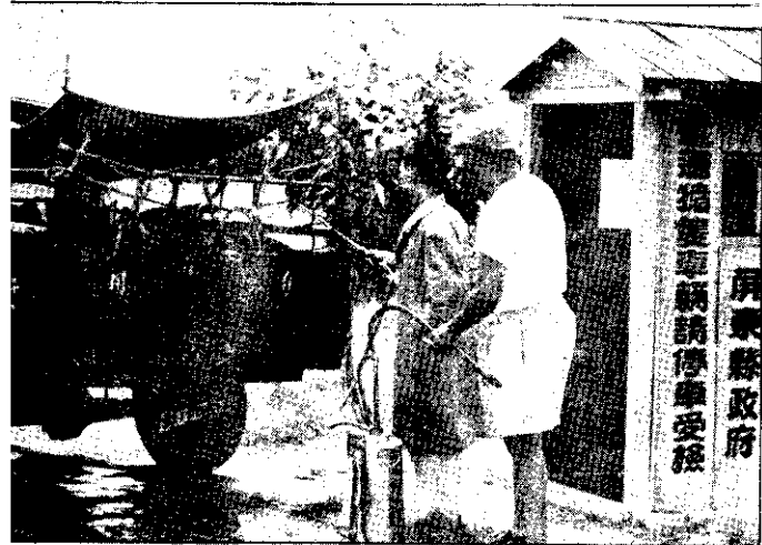
設點要通交在縣該，密嚴最縣東屏，瘟猪治防 。毒消和疫檢理辦，站疫檢有