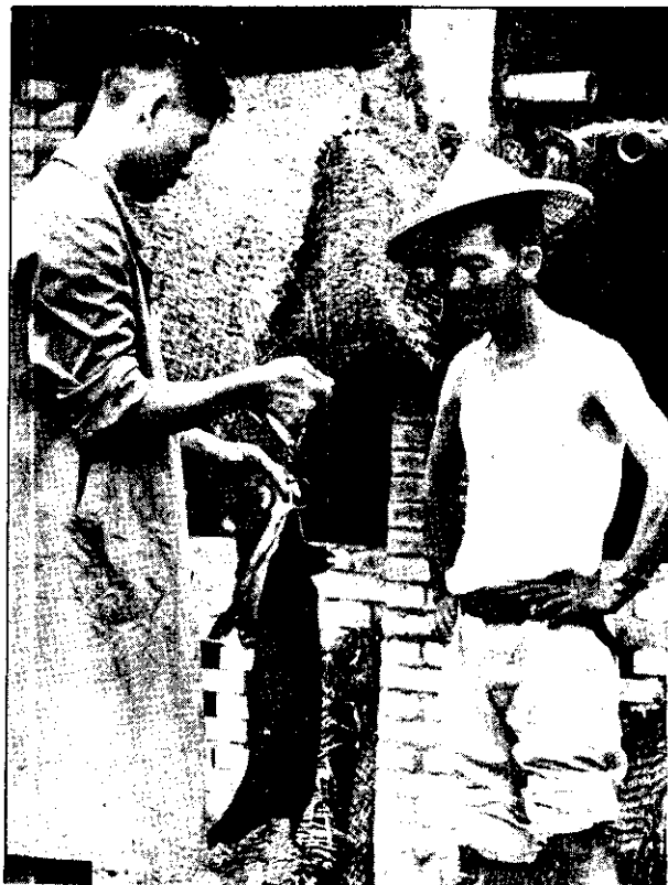
萬一因注射死了，政府就按重賠償。