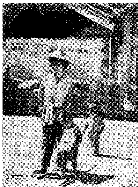
• 去家回子孩蕭寒，了完作工