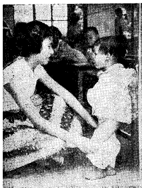
• 料照媽保有裡所兒托在們了孩