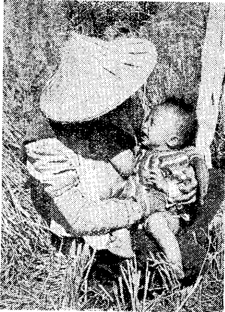
母親不能得到一刻的休息。