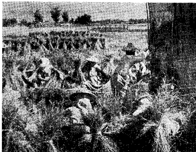
• 作工心安裡田在們媽媽