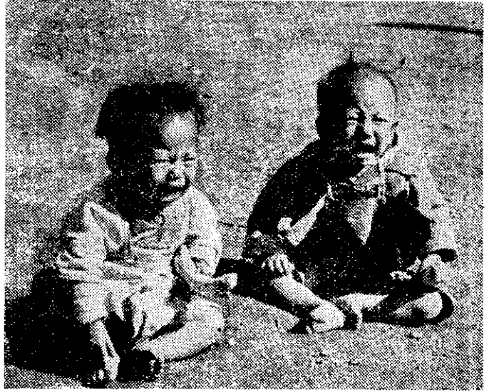
！憐可麼多得哭們他看你

現在婦女會，鄉鎮公所，農會，合作農場，農復會等有關機關，在各地發起農忙巡迴托兒所的組織，這真是農民們的福音。從這幾張照片裏，可以看到有托兒所和沒有托兒所的區別，希望各地農友凡是當地沒有托兒所的，趕快設法創辦，已經有的，更要想辦法使托兒所的組織更健全。