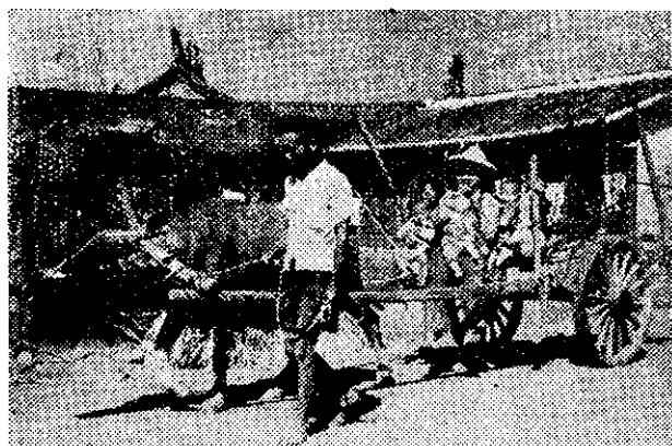
• 去所兒托到們子孩送