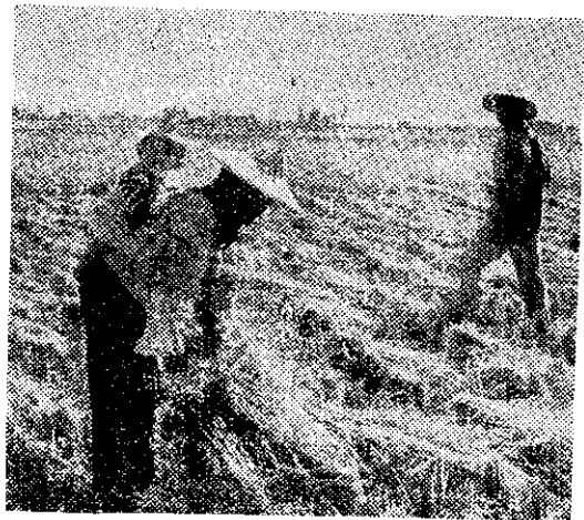
這樣還工作得好嗎？