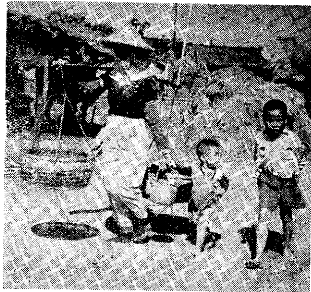
！便方不麼多去裡田到的女帶兒牽