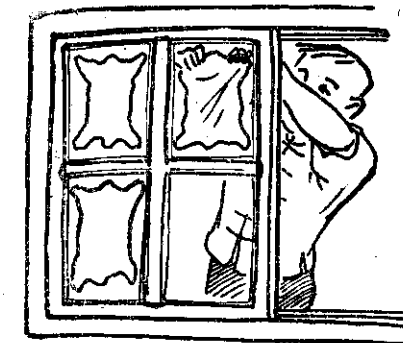
小皮可貼在玻璃窗板上，大皮可釘在門上。乾燥。

家庭鞣革，有釘在木架上的，也有釘在門板上。小張皮，可以貼在牆壁上，以行乾燥。等到半乾，取出刮軟，刮軟後，再釘板，使它平直，並行乾燥。通常是在空氣中，使它乾燥。