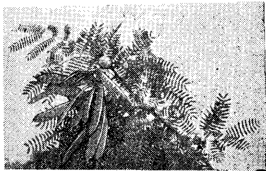
卿清方 組產生牧畜會復農

「利益很大的銀合歡」一稿，發表以後，各地讀者都發生很大的興趣，關於種子來源，種植，加工，使用法等等，不斷的來信詢問。有的寄來豐年社，有的寄到農復會。現在把各方面的來信，綜合成十幾個問題，解答如下：