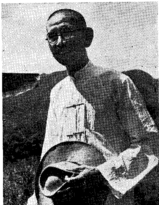
友農烈錫石的農從醫改

一片荒地，除了一甲單期作水田與沒有什麼生產價值的二、三甲旱地之外，其餘都滿山茅草，大約九甲左右的石頭荒山。