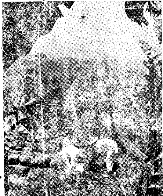
動流的壤土防止，圍石成築頭石的內園蕉香用利

(三) 這幾年來以糧食增產為主要工作目標，水稻品種則選擇適宜於本地的「臺中六十五號」及「臺中特六號」，同時改善栽培技術，現在每甲地約有八千臺斤之收穫，比附近農家的約有百分之三十以上的增收。