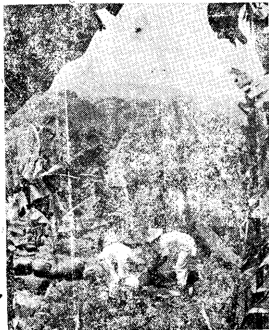
動流的壤土防止，圍石成築頭石的內園蕉香用利

(三) 這幾年來以糧食增產為主要工作目標，水稻品種則選擇適宜於本地的「臺中六十五號」及「臺中特六號」，同時改善栽培技術，現在每甲地約有八千臺斤之收穫，比附近農家的約有百分之三十以上的增收。