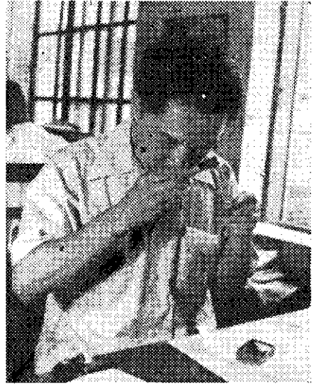
右圖：檢查農友來信附寄來的病蟲害標本。 左上圖：編輯們在商量如何繪製大樣。 右上圖：本社美術家在專心繪製封面。