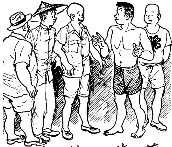
張 鄭 林 陳 蔡