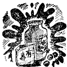
此。外像。包裝。谷仁。樂生。樂生。西。樂生。

有些藥物像P.M、富粒多、愛特靈、安特靈、馬拉松等，在農村是使用很普遍而有劇毒的殺蟲劑。裝這些藥的玻璃瓶，雖在使用前清洗過，可是却可能洗不清潔，如用來裝豆油，酒，茶油等是非常危險的。 農友們：為了避免中毒起見，應該將藥品用完後的空瓶，用肥皂水洗清，然後埋入土中。如為紙裝的，那麼就應該燃燒成灰，總之要盡量避免食物或皮膚與藥品直接接觸，以免中毒。