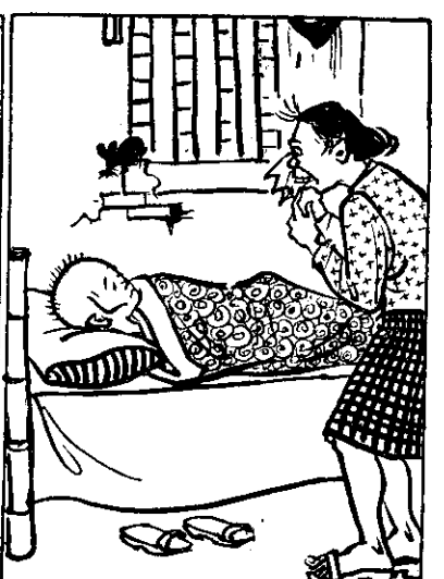
⑨ 因(的她)錢許小用所院病，理天無人害仙半，院出便好醫子。豬大慈運補錢(花)開