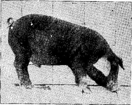
豬小康健：圖下，豬小血貧：圖上

吸困難，咳嗽，突然死亡。貧血症全年都有發生，但在冬季常常因併發肺炎，死亡率特別高。乳豬貧血症的防治就是要供給礦物質。在豬舍設泥土的運動場，或在豬舍內的一角放泥土，使豬隻從泥土中攝取礦物質，就可預防貧血症發生。已經飼養過豬隻的舊土，可能有豬蛔蟲卵的污染，所以泥土宜採用未曾飼養豬隻的清潔土。每日在母豬的飼料中，混入微量的礦物質也可預防乳豬的貧血症。臺灣大學畜牧獸醫學系配有一「豬安寧命」，加在飼料中餵豬，可以供給礦物質，防治貧血症。