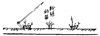
圖茶老的新更植新能只：志圖

⑤ 只能新植更新的老茶園 在桃園八德鄉，臺北林口鄉等，可以發現少數接近荒廢的茶園。這種茶樹，很難剪枝更新，最好在老樹行間，新植優良