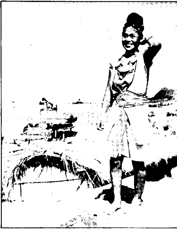
。裝正的人婦貴嶼蘭：圖上