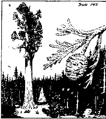
美國西部巨大松的種子，落地後發芽。一棵巨大松，可活四千年，樹高達七十五公尺，樹圍三千