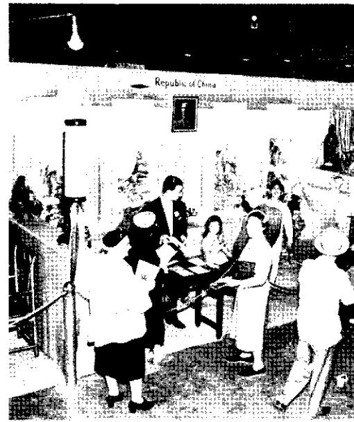
在團體觀衆的間晚。隔一的會覽展品商際國區 。前攤設