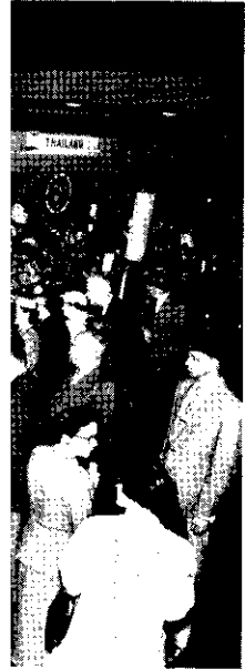
↑ 中國展覽攤位的盛頓州