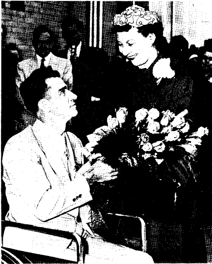
↑ 藏維斯紀念意工社慈善團體，專門救濟廢者、使適得 當的工。圖示艾森豪總統夫人為該社新址主持揭幕禮時。 接受一位殘廢者獻花。