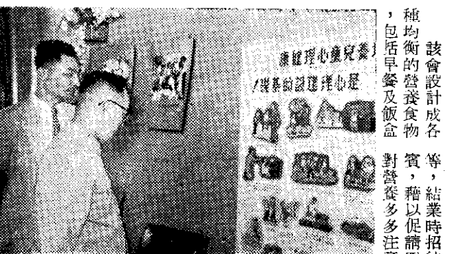
該會設計成各種均衡的營養食物，包括早餐及飯盒，對營養多多注意。

近來有少數農民對於使用PM等有機磷藥劑，因疏忽大意以致中毒死亡，農林廳深爲重視，已再函請各縣市政府及縣市農會(澎湖除外)轉飭各鄉鎮公所及鄉鎮農會，於分配藥劑時詳加說明，經常派員實地指導，並加強宣傳，使農民瞭解，時加注意，免生不幸。該PM乳劑之毒力，雖不如「富粒多」及「巴拉松」之烈，但均同屬有機磷殺蟲劑，具有官能滲透殺蟲作用，在使用上應參照「富粒多」使用上應注意事項，慎重處理。該注意事項，會，日前已結業。