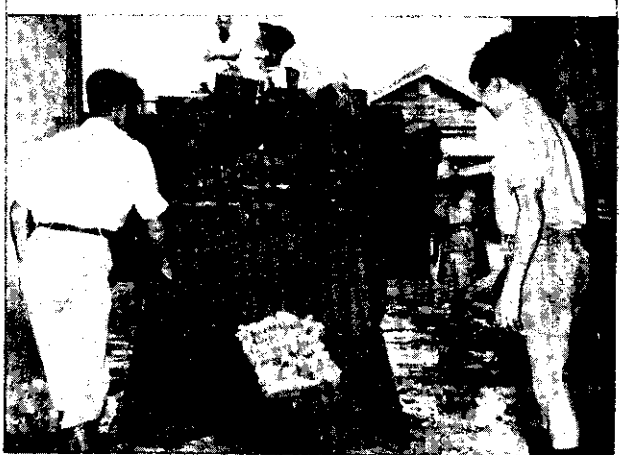
由各地及萬華站，用卡車運來大宗的鮮魚。