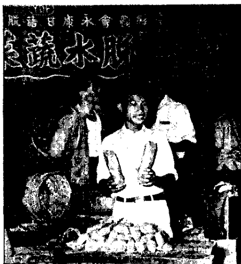
場在，菜蔬水脫的做所廠工水脫康永南臺。 躍躑客顧，力得傳宜於由，賣販內