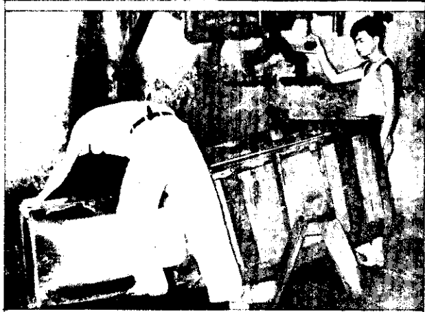
市場的製水廠，是專為水凍鮮魚而設的。