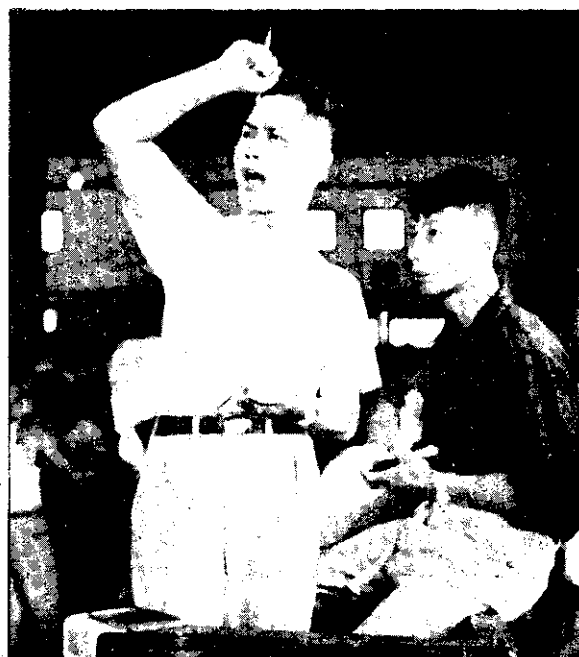
魚市場內的拍賣人員，高聲叫賣的實況。像這種拍賣人員，場內一共有八人。