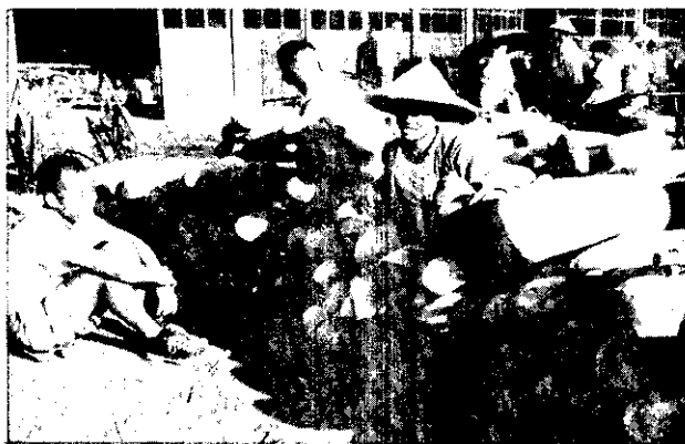
到了上午九時後，顧客已漸稀少，菜販們便席地談天。