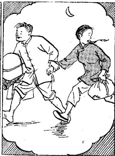
管不，（意同）意甲若人二女男⑦庭家人變。（情事）志代的信迷。起做來生更力自，離脫來