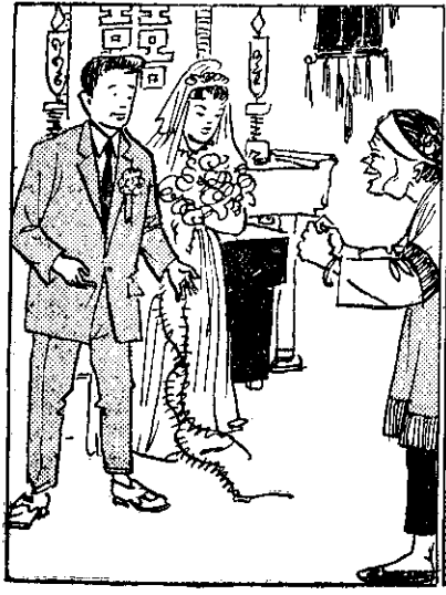
愛着字八信迷，意同有了聽母父⑨孫帶婆阿，時婚結仔花仔土。除。喜賀來