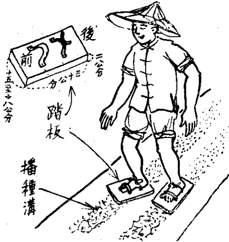
。壤土緊壓板踏用，土覆後種播

胡蘿蔔須間拔三次，每次間拔，須同時中耕除草。發芽二星期後，行第一次間拔。第一次間拔後三星期行第二次間拔。發芽後六十至七十日第三次間拔。生長太過旺盛，葉色過於濃綠，頸部太肥大的，都應拔除。三寸種應間拔成株間二至三寸，五寸種為三至四寸。第二次間拔時，苗株已生長強健