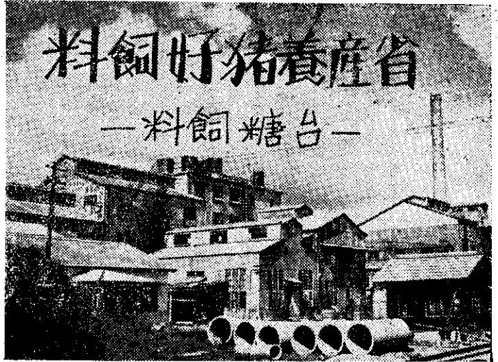
景外廠工加產副營新司公糖臺

料的示範試驗。這項試驗，又獲得了良好的成績。因此，臺糖公司最近才正式出品臺糖飼料，供農友們使用。