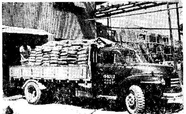
(攝朝職朱) 料飼糖臺的出運待正車卡上裝

在這裡還要提請各位注意一點，就是當你們用臺糖飼料養成大豬以後，不要上商人的當，用「估重量」的方法出賣。因為用臺糖飼料養豬，瘦肉較多，所以，豬腹沒有肥大下垂的現象，從外表估量，好像很輕，但實際上有相當的重量。因此，讓各位農友，使用臺糖飼料養成的豬，一定要秤量出賣。(阿明)