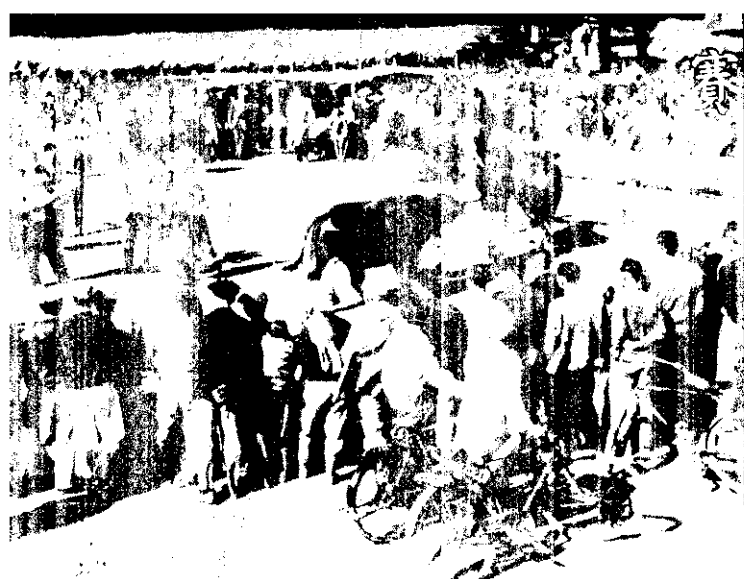
比查審回這，驗經的屆一第了有：形情查審的組牛水 。速迅易輕較

為着提高耕牛品質和增加農友們對於飼牛的興趣，今年度的耕牛比賽，由北平開始，已在新竹東門國民學校舉行了。這回的比賽的特點，是由每一鄉鎮各選出二頭牛，比賽的單位分水牛和黃牛，其中再分別雌雄，共分四組，這樣審查時可以更為公平正確。今年參加比賽牛隻的體格，一般都較往年優良。