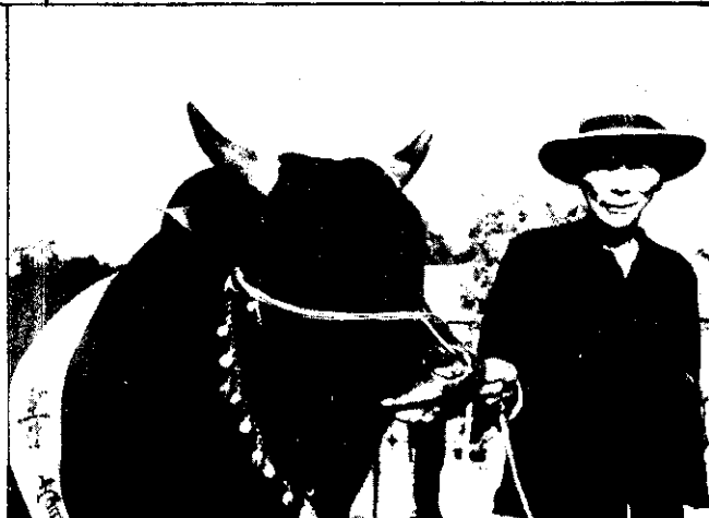
。獎一第組牛公牛黃得獲友農山金陳縣栗苗