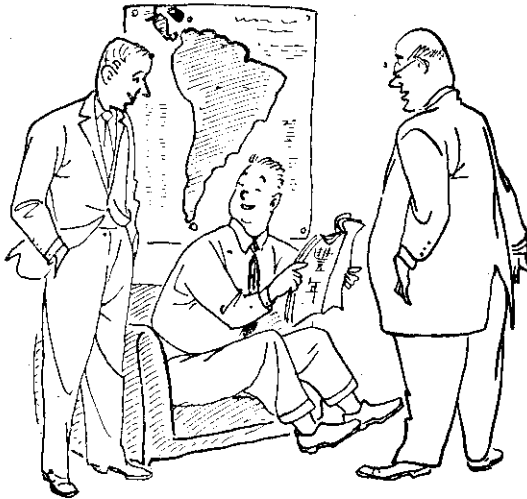
不認識外國的文人，對「年豐」也有興趣。