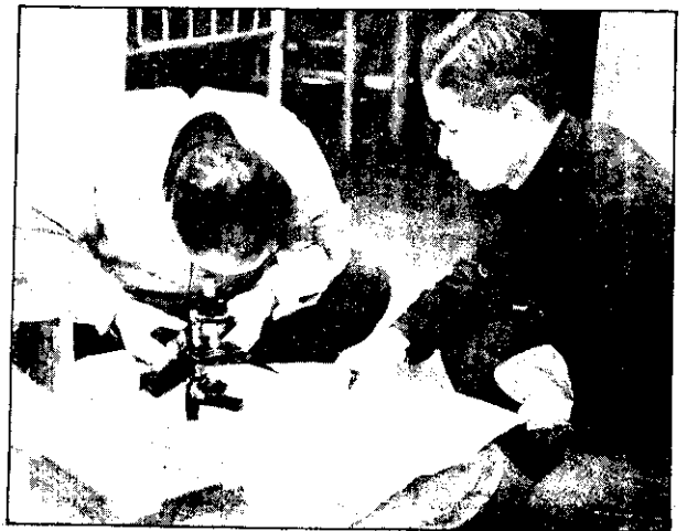
投工人魚香督監透溪店新在駐，家專派處管魚。 。率化解查檢，鏡微顯用家專：示圖，作工精

香魚的俗名鱈魚，因其形態秀麗，肉味鮮美，自古以來身價高貴，現在，每公斤批發價四十五元，是食用魚中很名貴的魚類。 農林廳魚管處為增產香魚起見，每年十二月至正月間，在新店溪邊採用人工授精法，繁殖這種名魚。據稱：一般類的人工授精，是一雄對數雌；香魚却是一雌對六雄，因為每條母魚能產一萬個魚卵，所以，需要較多的雄魚。人工授精的孵化率達八成，生長率亦達三成，預定每年作三十萬卵的人工授精，將來當能大量增產，為嗜好香魚的人們增加口福。