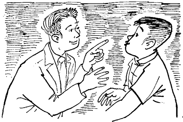
談 閱 者 編 與 者 讀

們得到回信的時間，所以讀者們如有因本刊文稿直接引起的問題，如希望較快的得到答覆，請向編者們提出，我們不能回答時，再轉詢原作者或是其他有關的專家。