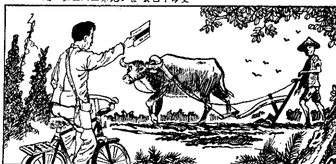
○ 作工農田在兄兩着幫便，後年四校學民國完讀，輕最紀年盜阿 ○ 令集召到接忽，候時的田耕在正他當，天一有