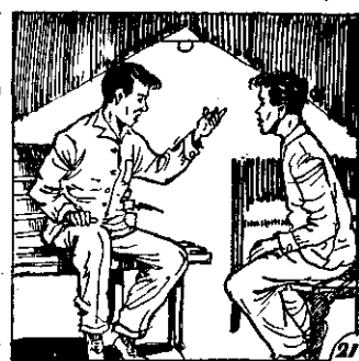
○ 了管入後先煙已淨教林與欽長高，時是