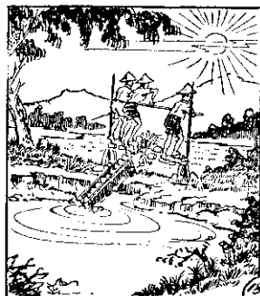
○ 盜阿三妻，波阿二妻，石溪大老