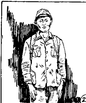
○ 足十氣神表外，裝軍上穿盜阿 ○ 同妻很却心內