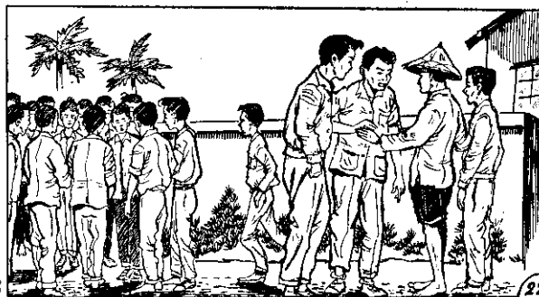
○ 大盜阿比鄰紀年的人兩為因，淳秋與欽長識認盜阿 ○ 盜阿射眼們他托以所