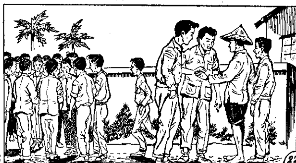
○ 大盜阿比鄰紀年的人兩為因，淳秋與欽長識認盜阿 ○ 盜阿射眼們他托以所