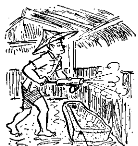
豬舍及體內體常消毒

濕熱的豬舍，沒有遮蔽的運動場，豬隻互鬪、疾走，都會使豬發生日射病。發生日射病的豬隻，應移在涼爽的地方，用布袋或其他東西浸水後覆蓋在豬頭部豬體，並注射強心藥品。