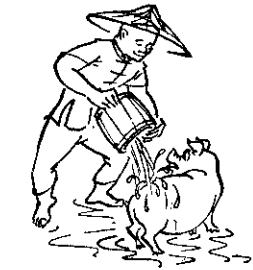
熱天澆水可增豬的食欲

夏天氣溫高，飼料容易腐敗，腐敗的飼料，容易使豬隻瀉痢。廚房殘滓、米糠等容易腐敗，應特別注意。飼料槽中剩餘的飼料，在下次給飼時，應全部取出才可