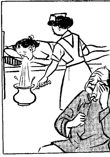
⑤ 毒藥食無了(不久)久，趕緊 將伊返送醫，好得緊救生命， 若無二人歸陰府。