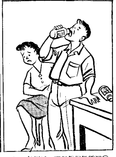
④ 這風俗無理，婚姻成(不成) 成，死如不(成)去，買毒來食 去，離分不毒服雙雙。