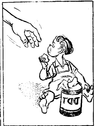
④ 有毒農藥要注意，好麵食件用食 要起收農藥若無收離，起收要（品 誤食中毒就死，（來起銷