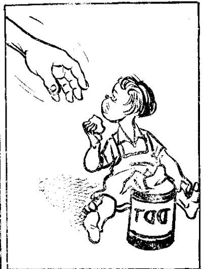
④ 有毒農藥要注意，好麵食件用食 要）離離收無若藥農，起收要（品 。死會就毒中食誤，（來起銷

的留種法，就不是單從文字來學所能夠精通的。還必須實地學習，多多請教有經驗的人，才能澈底領悟。不過學理上的常識，還是非常重要的，必須先知道了才行。 （本文為胡先生給本刊臺中讀者黃虎君的疑問解答。）