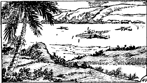
○至而跟跟已隊部的軍聯，候時的成完要將場機飛的禁所人日