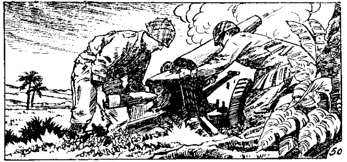
○寒肥人今來起能，設山動震聲砲的近附