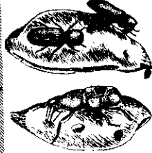
(F)象谷和(上)欄谷放 上米在示表圖大放

①新舊甘藷簽不可堆在一起。②倉庫的門窗最好加裝鐵絲網，防止外界害蟲飛入產卵。③隨時注意害蟲發生的情形，來做適當的處理。