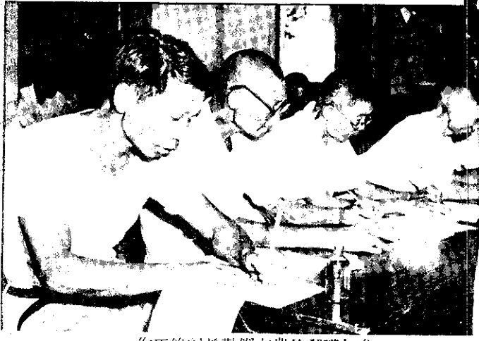
參加講習的農友們勤於記錄工作。