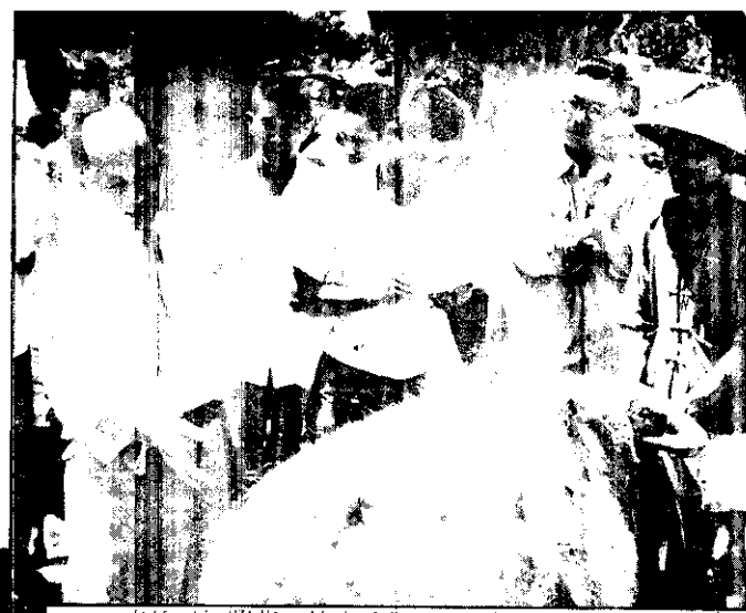
農友們仔細聽着政府技術正莊開講。指導的牛。

農友們飼養豬隻，有的很成功，有的却失敗。這種情形不限於養豬，凡是飼養畜產的都是一樣，所以，除勞力和金錢外飼養的技術與知識，是成功之鍵。最近臺北縣政府為了發展農村副業，提高農民飼養畜產興趣，在中和、三峽、土城、三芝、金山等五個鄉鎮，分期試辦畜產講習會。聞此次講習會，因講習師們，以簡單的比喻和平易的語言說明，農友們都明瞭，參加的也很多，結果成績很圓滿。