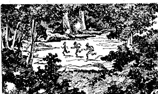
命拚便！「逃」笨賊的阿而約不，人三塗阿與洋秋、欽長 ○奔飛地 60