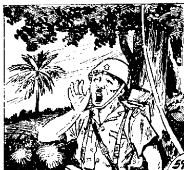
日見聽聞然突！「賊捉！賊捉」 ○叫狂下山在兵本 59