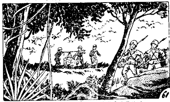
回敵件機將兵毫的份部一，來上進街步着舉兵惡的下山 ○進地續繼份部一，走續拍原 61