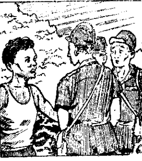
○上均的菲的日清會着磁上踏 66