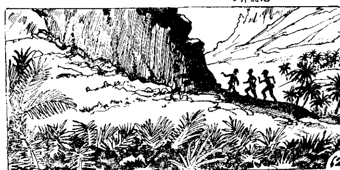
人三們他，方地的身族般隨是盡山過，樹椰的天季，草野的徑沒 ○走地日的無，山一過翻山一們他。擊追的兵日了過逃於終 62