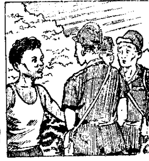
○上均島的諾日清會着磁上踏