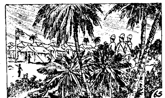
○降投軍聯向山下定決，氣勇起鼓們他