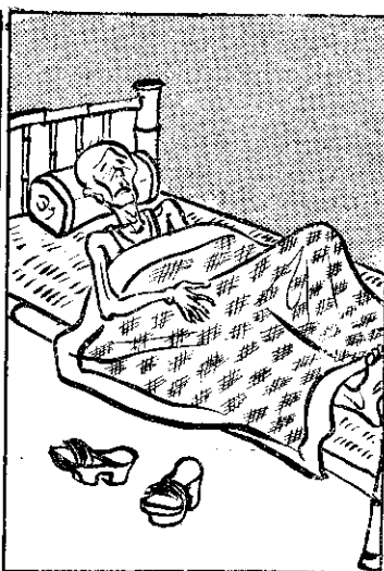
燒重反頭症，除無病落食丹仙② 時過已來請生醫，離（不）飭 。去死就大阿久不，