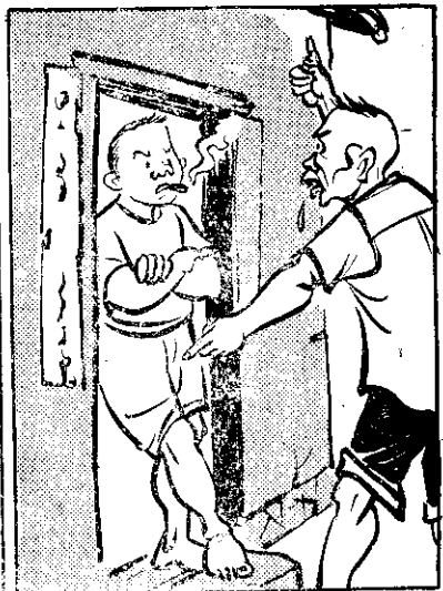
④ 一邊個一叫阿枝，阿枝在實真無 理，看見阿枝就問，真受氣。