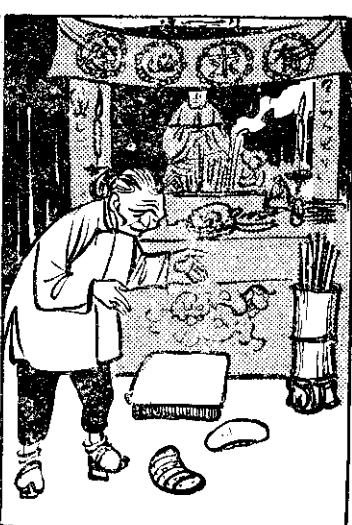
問錢用婆阿，悲堪實症病火阿① 前神，庇補求卦卜籤抽，醫神 。去回帶（灰香）丹仙