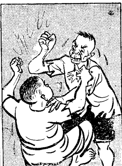
⑤ 人相罵無 (不) 讓步，大苦家勸 無。法度 (辦) 起，動手脚裂破 。拍甲 (打) 得 (水) 濕 (糊) 糊。