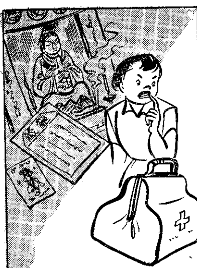
⑥ 鷓鴣失落無通，應該詳細查分 明，仙丹 (若) 有靈，有病那使 (必) 請醫生。