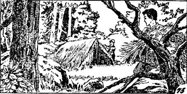
○屋茅難克棟一了好好，夫工的多天雨了化，人兩潭秋和秋長