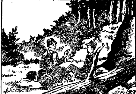
上山在便，進前止停婆阿顧照着為，潭秋和秋長 ○法辦堂衙家大，來下歇停