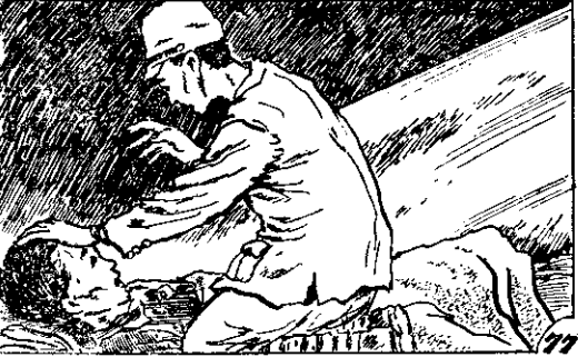
○呻吟的微較出發常時哀嘴，上廷軍在時婆阿 ○提馬發得覺，頭額的他擦擦，來下騎秋長