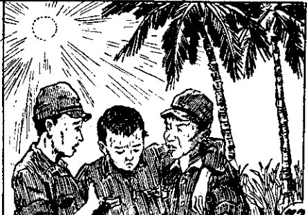
了人三們他，人無熱酷，氣天月五的賓律菲 ○來下倒病婆阿熱忽，路的天一