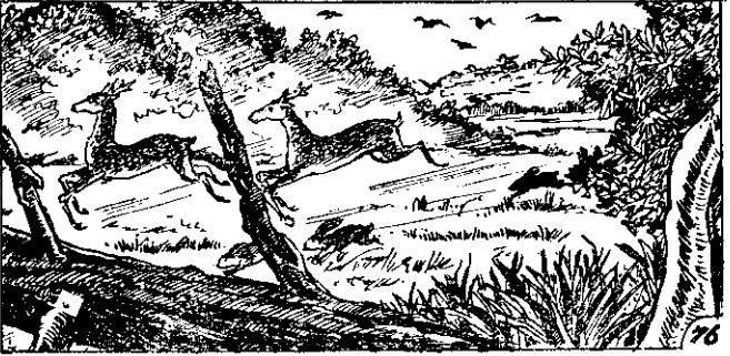
○眾眺的見野與虎山見看以可，鳴登鳥百到聽以可，近附上山