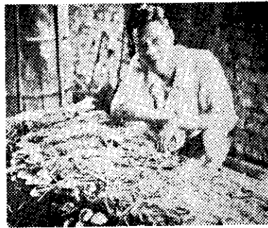
(菇草的成種乾阿黃)

，便是收聽得到的電臺多，比較一下就可知道。你還得再知道一個專門名辭——「變壓器」，你在電線桿（電柱）上端，有時可以看到一個黑色的大鐵箱，那就是變壓器。收音機內用的變壓器，當然要小得多，有變壓器的收音機，性能好一點。但是變壓器用久，最會發熱，熱到很燙手時，很容