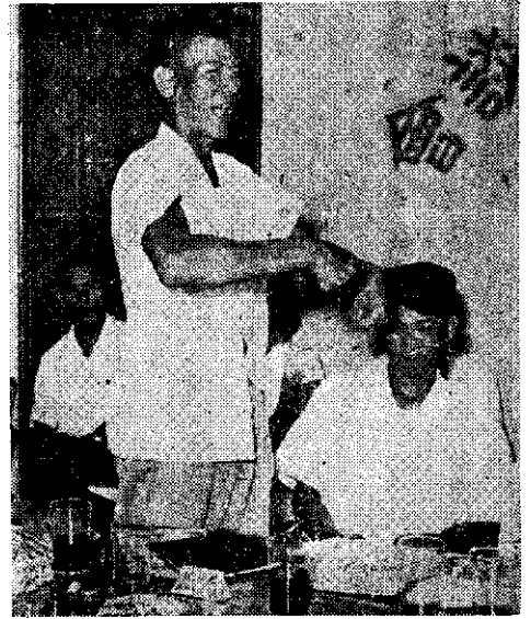
尤得水農友說：小型耕耘機很輕，兩個小孩子可以扛起來。

，每分地用一加侖半柴油。砂質土每天可整五分地，每分地用油量不到一加侖。耕犁深度約五寸，比用牛約深一倍。