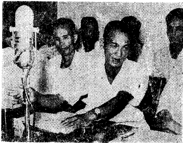
陳萬發農友說：價錢太貴了。