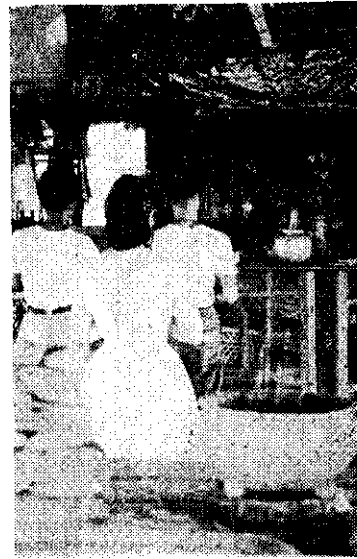
的豆麻在女信男香 拜跪中廟草歲千府五

所謂「五府王爺」的由來，據說是某一個朝代中，有三十六位忠貞之士，被奸黨設計陷害，忠魂不散，上天的玉皇大帝，冊封為首的李池吳朱范五姓為王爺，叫他們長駐人間，享受香火，他們的任務是代天巡狩，除暴安良。我們只要能領會到崇拜忠貞的原意，無論故事的真實性如何，也不問王爺的真身，是先到廟謁，或是先到麻豆那，就無關宏旨了。