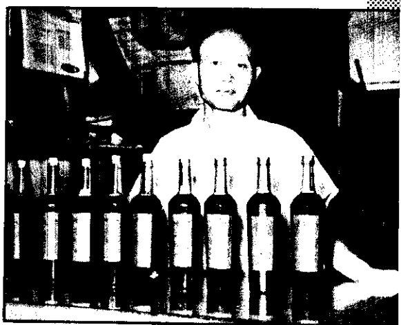
。蜂蜜隻萬一着養裏箱蜂的樣這像：圖上 新利大意的入輸助補會復農由：圖中 。大壯健強，種蜂 。蜜蜂的賣出備準，內瓶在好裝經已：圖下