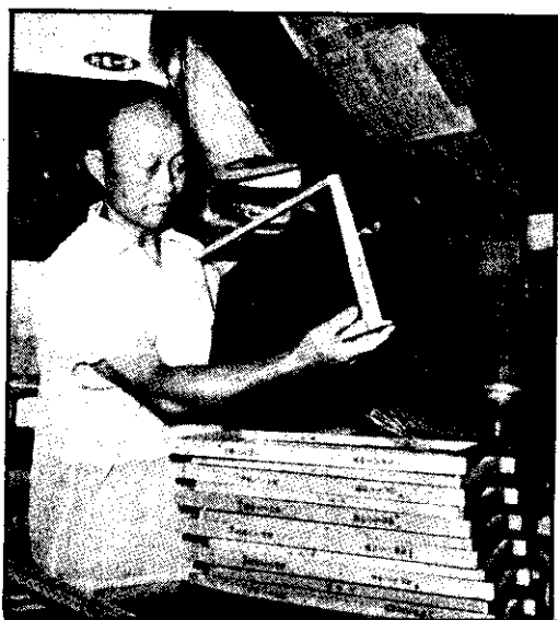
蜂工經，脾巢齊整的成製法方式新用。 。室藏貯的蜜蜂與蜂幼是，房蜂成做