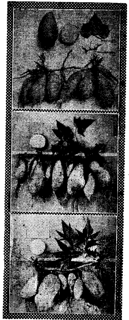
號五十五，號四十五農臺：下至上由。號七十五