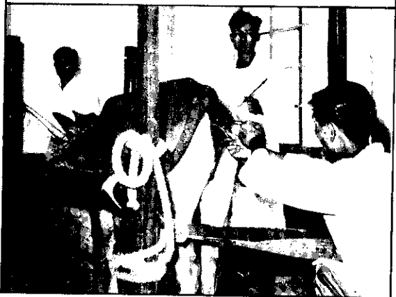
。液精的牛度印取採工人，裡室精採在：圖上