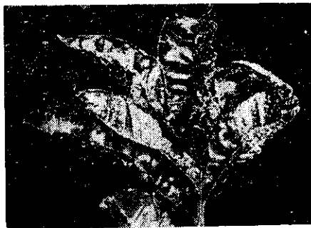
曲扭形畸葉病病痂瘡

「瘡痂病」發生於柑橘的葉、枝和果實。因病斑的形狀很像疥癬的結疤，所以稱為「瘡痂病」。 目前柑橘的幼果已漸漸成熟，瘡痂病的病徵也漸漸明顯。本省柑橘重要產地如彰化縣的永靖鄉、埔心鄉、大村鄉，臺南縣的麻豆鎮，屏東縣的內埔鄉，及宜蘭縣的蘇澳，臺北陽明山、林口鄉、淡水，及新竹的石崗子、新埔、寶山等地的柑橘都發生這病害。 本省的椪柑及酸橘最易感染瘡痂病，桶柑次之。柚類被害很輕微。抗病性最强的品種是雪柑、晚生橙、臍橙。潰瘍病也是本省柑橘最普遍的病害，發生的部位與瘡痂病相同，兩者的病徵在發病初期差不多一樣，不過病斑長大後，如果詳細觀察就可區別。 瘡痂病的病斑常集成不規則形，葉背較多，葉的一面呈小瘤狀隆起，另一面成錐形體突出，外觀粗糙，呈木栓化，淡橙色，病斑周圍無黃色暈圈，病葉畸形扭曲，果上的病斑與葉上的相似。 潰瘍病的病斑為圓形，生於葉的兩面，葉面葉背的病斑差不多都在相對的位置排列，病斑周緣突起，中央處凹