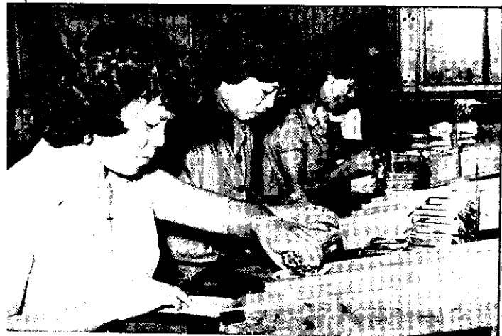
一拿就是二十支。 熟練的包裝小姐，隨手