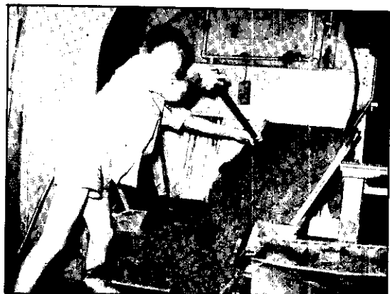
在菸絲裡攪和香料。