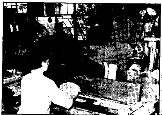
這架捲菸機，每分鐘可捲一千五百支。