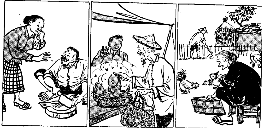
① 溪州李老二（和甲）苦老（敬可）老 ② 婆（耐）再（勤）愛買（宜）真 ③ 張壁（勸）伊勸 ④ 伊勸（勸）伊勸 ⑤ 老日（將）伊共 ⑥ 李去（買）魚 ⑦ 茶（買）魚 ⑧ 市（買）魚 ⑨ 一（買）魚 ⑩ 見（買）魚 ⑪ 堆（買）魚 ⑫ 臭（買）魚 ⑬ 苦味臭着嗅，見看來 ⑭ 便雖件物爛腐，（他勸）伊勸 ⑮ ？（必何）吓下是毒中了食，宜