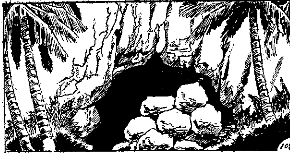
肉們的牠吃到想有波却, 口洞在堆塊石們牠, 兜這間夜歐野止防着為