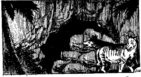
到看, 尖太眼眯但, 去渡來渡口洞在, 猴隻兩了米上晚天二第 〇投入肯不, 異有上地