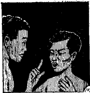
和魚香吃天天]: 說飲長對洋我。 「肉吃想我, 多過酸胃, 果芒