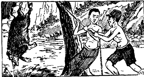
用來出人兩。動搖在子她見看洋秋, 時覺睡想正們他, 天三過經 〇嶺山隻一足峇原, 壯一力