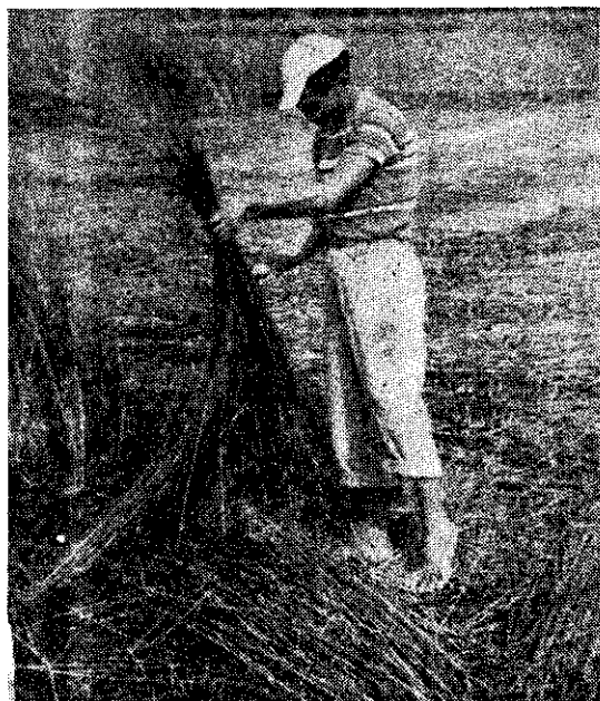
席草收割後，隨即分等