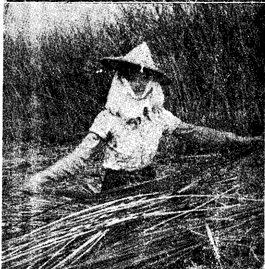
割席草的工作，需要熟練的技術

的席草，草頭黑色，所謂「烏草頭」，品質不及臺南的。席草種植以後，每年可以收割三次，約在新曆的二月六月及十月；收割若干次以後，需要掘起草頭，重新種植，才不致影響草質。