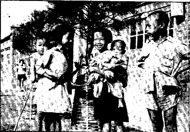
鹽工子弟們在新建成的鹽村中。

本省中南部海濱有幾千戶人家，他們不是漁民，也不是農民，他們賴以為生的是四千多甲一望無邊的白色鹽田。除了這裏刊出的幾張照片以外，本期十八頁並有「一篇『海水是怎樣曬成鹽』的報導，對於我們每餐不能缺少的食鹽，增加一點智識，想是每一位讀者所樂於知道的吧。」