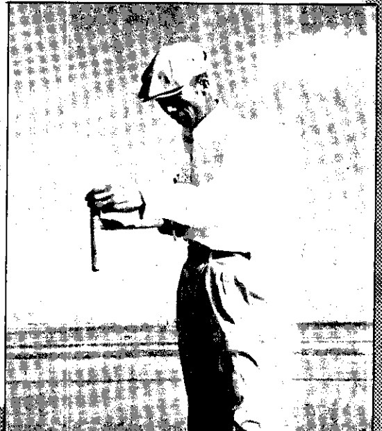
蒸發中的海水，隨時舀取水樣測定濃度。

本省中南部海濱有幾千戶人家，他們不是漁民，也不是農民，他們賴以為生的是四千多甲一望無邊的白色鹽田。除了這裏刊出的幾張照片以外，本期十八頁並有「一篇『海水是怎樣曬成鹽』的報導，對於我們每餐不能缺少的食鹽，增加一點智識，想是每一位讀者所樂於知道的吧。」