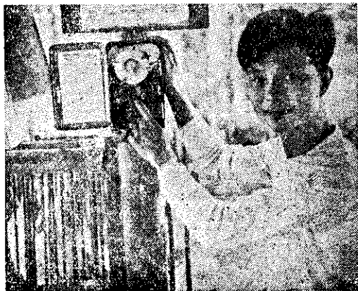
點燈籠用電自開關開機