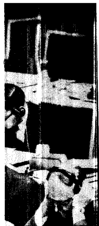
也維在署總能子原際國 ▲ 在正團表代國民華中示圖。