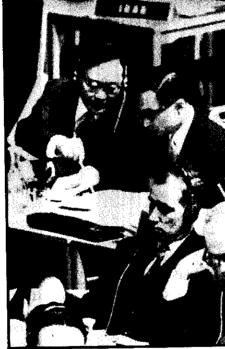
表代法合的國中為國民華中認承議決，會 。氏仁學魏問顧團表代國中為人一第左排

博道政李的金獎學理物爾貝諾年 愛得獲會氏二楊李，前之金獎爾 。影留家學科他其與會年